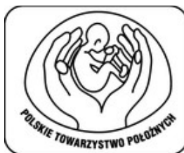
Polskie Towarzystwo Położnych