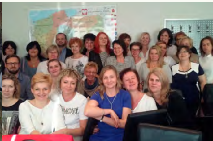
Rozdanie dyplomów ze szkolenia specjalizacyjnego w dziedzinie „Pielęgniarstwo chirurgiczne”