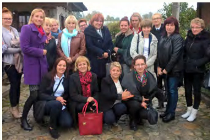
Uczestnicy szkolenia specjalizacyjnego w dziedzinie „Pielęgniarstwo opieki paliatywnej”