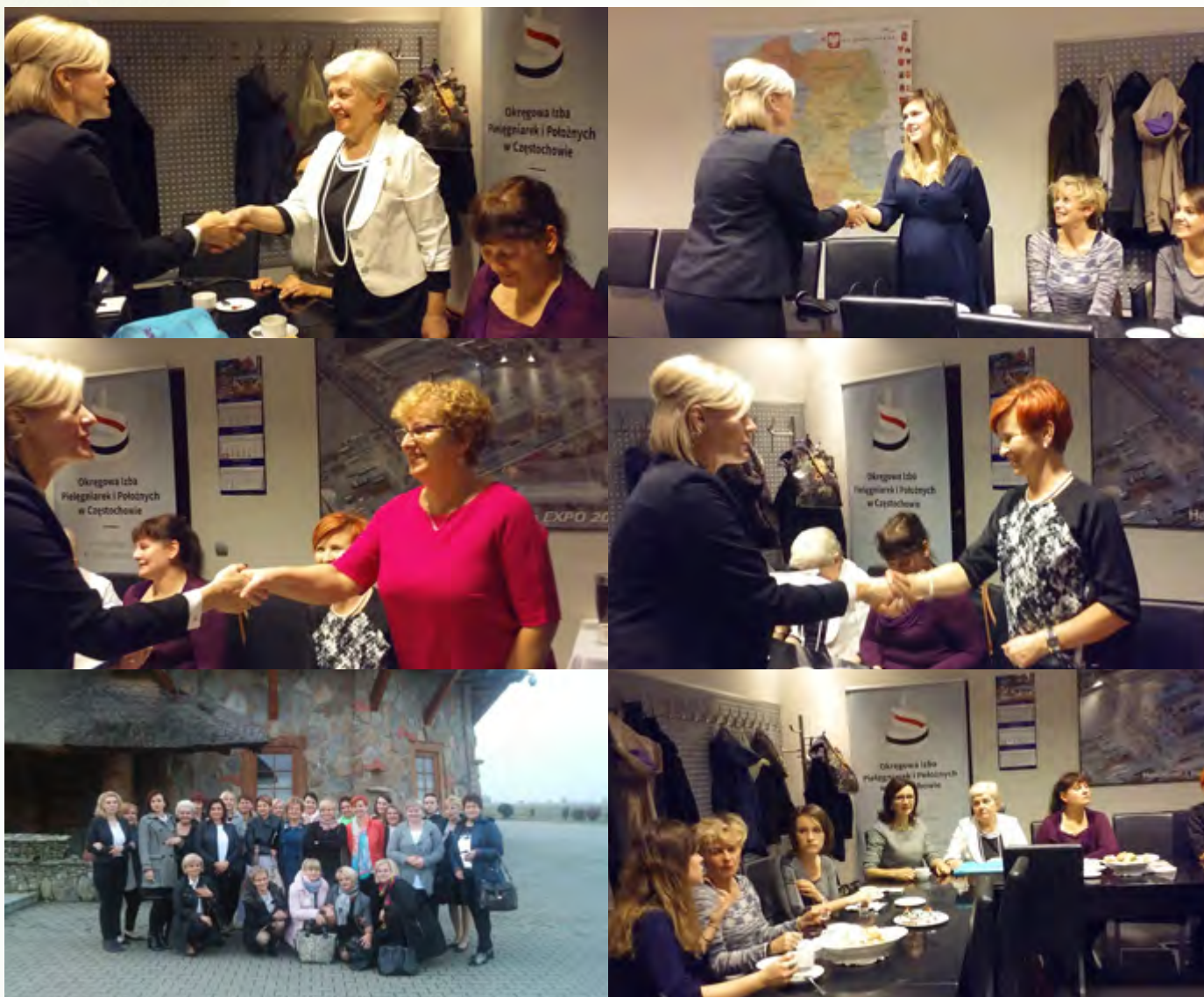
Rozdanie dyplomów ze szkolenia specjalizacyjnego w dziedzinie „Pielęgniarstwo ginekologiczne”