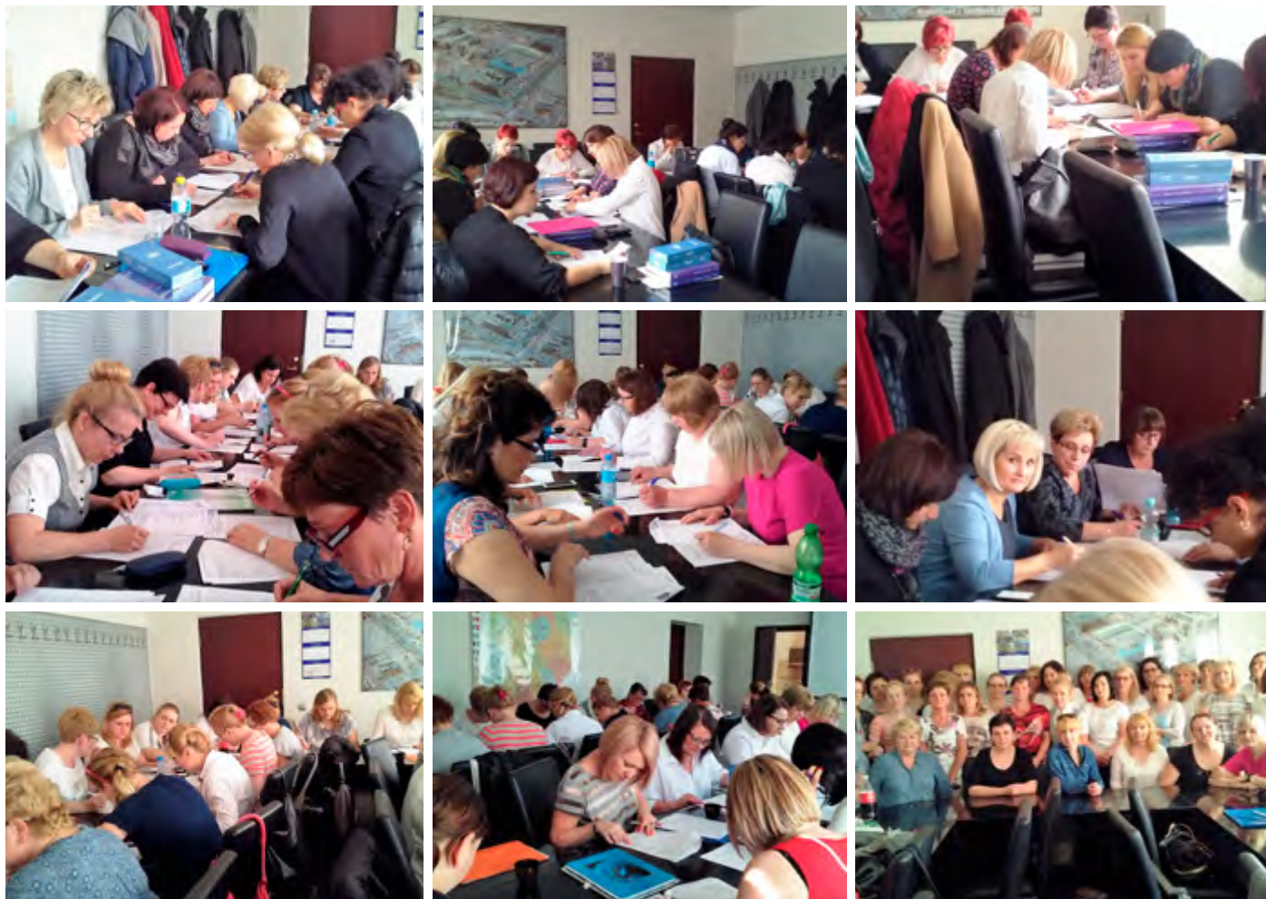
Egzaminy wewnętrzne ze szkoleń specjalizacyjnych w dziedzinach pielęgniarstwa ginekologicznego i pielęgniarstwa pediatricznego.