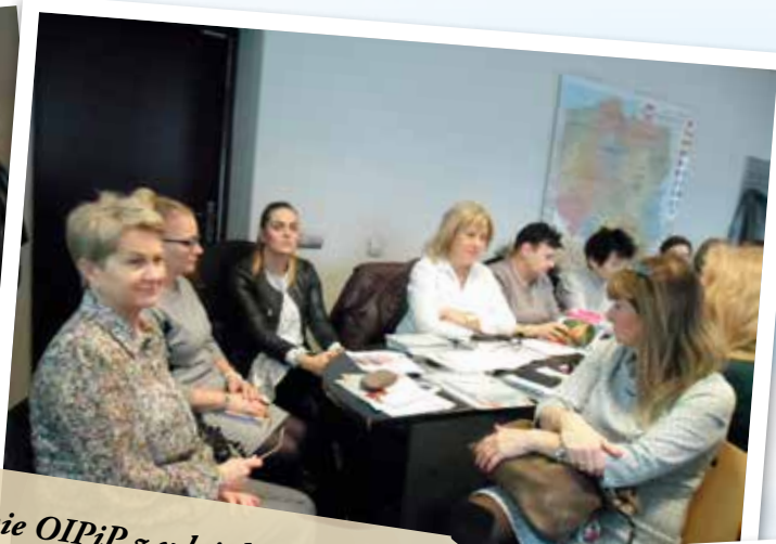
Szkolenie OIPiP z udziałem Powiatowej Stacji Sanitarно-Epidemiologicznej