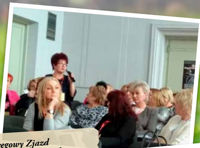
Okręgowy Zjazd Pielgniarek i Położnych